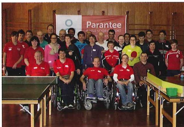
Niets dan lachende gezichten bij de groep van TTC Zele