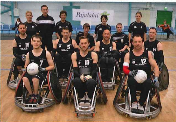
De Belgian Lions in Finland

Van 14 tot 18 mei vond het Open Nordic toernooi in Finland plaats. Ons nationale team bereidde er zich voor op het EK later dit jaar. De Belgen deden het goed, maar konden de échte toppers niet bedreigen. Tegen Europees kampioen Zweden leidden enkele persoonlijke fouten tot een vijfpuntenkloof. De veer was gebroken en uiteindelijk eindigde de wedstrijd op 49-60 voor de Noord-Europeanen. De volgende dag stonden twee wedstrijden op het programma. Allereerst was Duitsland, dat de Belgen op het vorige EK uit de halve finales hielden, aan de