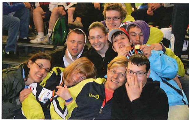
De sfeer zat er goed in op de Special Olympics