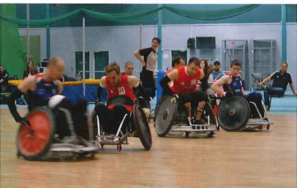
Het nationale rolstoelrugbyteam eindigde derde op de Open Nordic

beurt. België kon gedurende de volledige wedstrijd controleren en besliste dan ook om enkele nieuwe spelers hun eerste internationale speelminuten te gunnen. België won de wedstrijd met 47-41. Later die dag stond het machtige Groot-Brittannië op het programma. Deze wedstrijd was een ander paar mouwen, maar de Belgen verloren uiteindelijk vrij krap met 47-53. De laatste dag van de competitie stond België oog in oog met Finland. Een wedstrijd die ze op papier moesten winnen vanwege afwezigheid van hun sterspeler Leevi, de "most valuable player" op het vorige EK. Bij de rust stond België al twaalf punten voor, het werd uiteindelijk 53 - 45. België sloot deze competitie af op een derde plaats, het moest enkel Zweden en Groot-Brittannië voor zich laten. Een eerlijke en correcte plaats gezien het niveau van het team en dat van de tegenstanders.